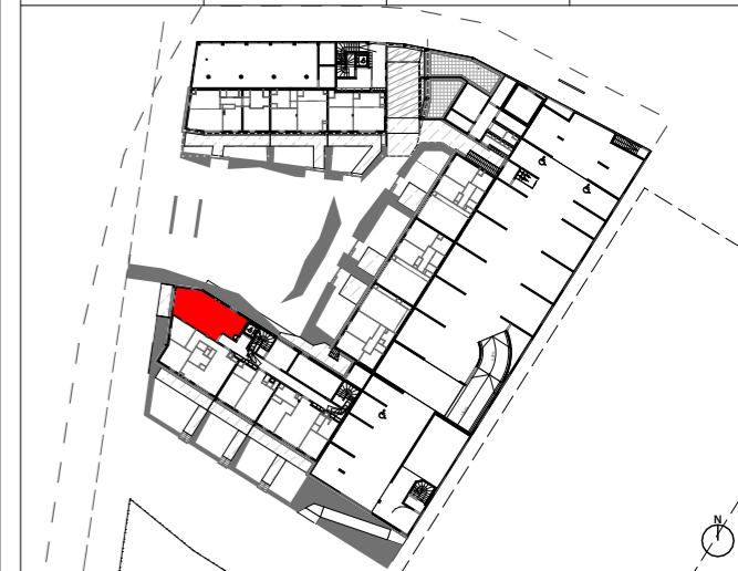
Tableau des surfaces habitables