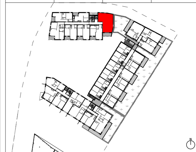
Tableau des surfaces habitables