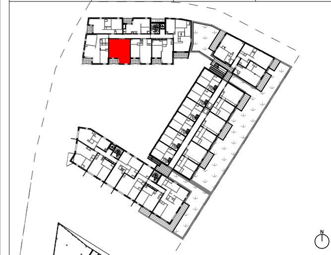
Tableau des surfaces habitables